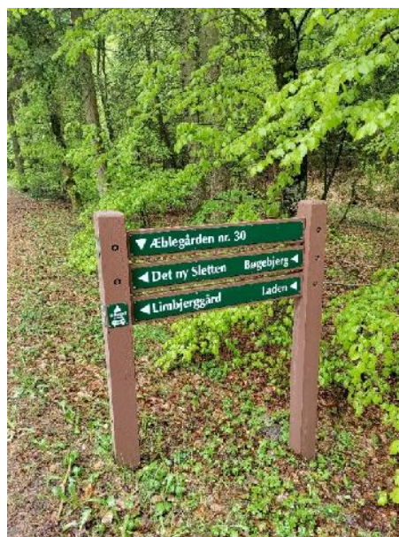
Startsted for løbet